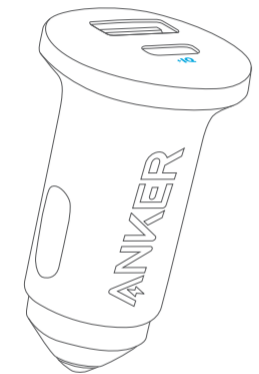
Anker 323 Car Charger (52.5W)

DE: Verwendung Ihres Produkts ES: Uso de su producto FR: Utilisation de votre produit IT: Utilizzo del prodotto