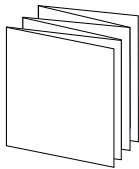
Инструкция по эксплуатации