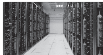
техническое обслуживание сетей связи