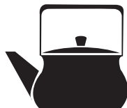
Посуда из сплава с низким содержанием железа