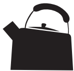
Чайник (эмаль/ нержавеющая сталь)