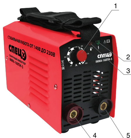
Рисунок 1. Общий вид.

На рис. 1. представлен общий вид инвертора.