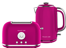
GL2916/ GL0346 МАЛИНОВЫЙ ДЖЕМ