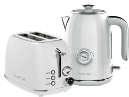
GL2922/ GL0352 СЛИВОЧНЫЙ ЗЕФИР