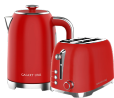
GL0349/ GL2919 ФЕРРАРИ