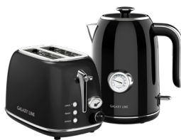
GL2920/ GL0350 МАГИЯ ЧЕРНОГО