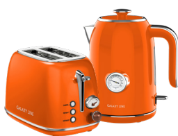
GL2921/ GL0351 АПЕЛЬСИНОВЫЙ ФРЕШ