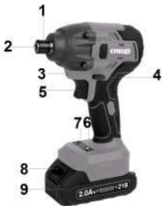
Рис. 1 Общий вид шуруповёрта

1-фиксирующая втулка; 2-патрон; 3-светодиодная подсветка; 4-переключатель реверса; 5-выключатель; 6-кнопка выбора величины крутящего момента; 7-указатель величины крутящего момента; 8-фиксатор аккумулятора; 9-аккумулятор;