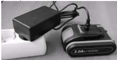
Рис. 2. Зарядка аккумулятора

-извлечь штекер зарядного устройства из аккумулятора, вставить последний в дрель до щелчка фиксатора.